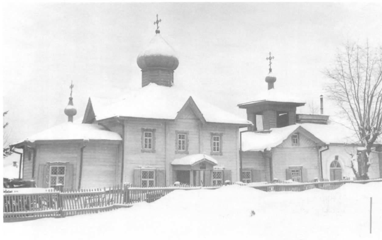
Бывшая Ильинская церковь